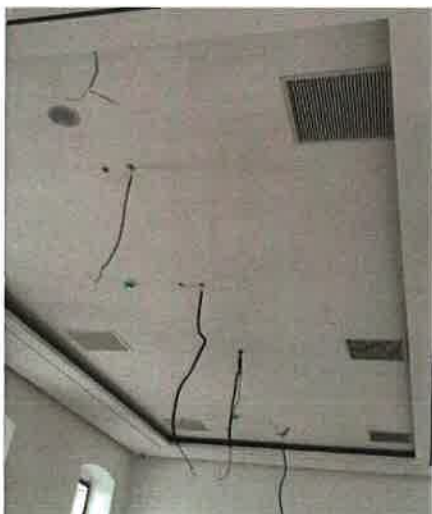
Foto: Cabluri iluminat, aripa stanga

Circuitul electric pentru prize există și are continuitate.