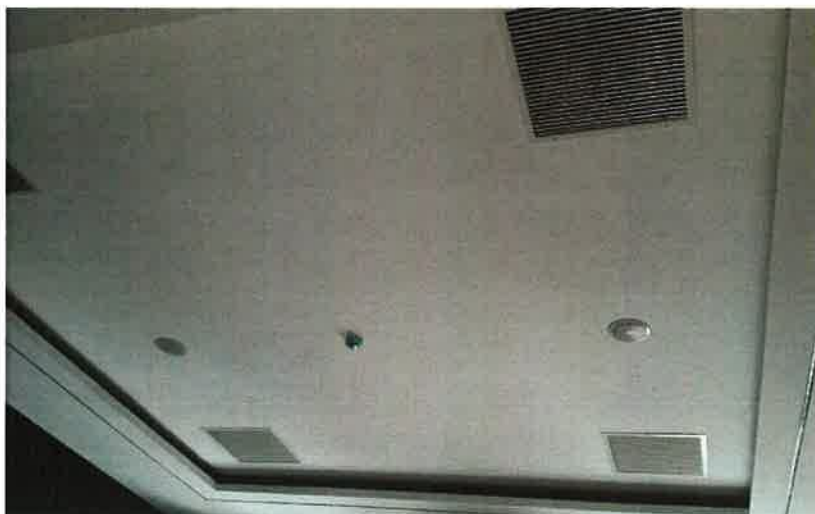
Foto: Cabluri iluminat lipsa, aripa dreapta